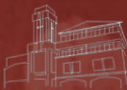
武吉巴督聚会 Bukit Batok Congregation