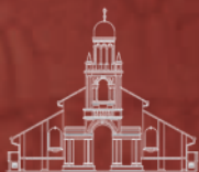
鸟节路聚会 Orchard Road Congregation